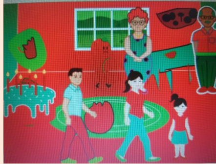
نمذ محالیت دانش آموزان

آشنایی با محیط نرم افزار اسکرچ جونیور، ایجاد و تغییرات اسپریت ها، آشنایی با نحوه ذخیره سازی و بازگشایی پروژه ها