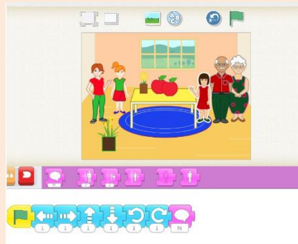
نمونه فعالیت دانش آموزان

آشنایی با بلاک های صحبت، صبر کن و استفاده آن ها در برنامه نویسی